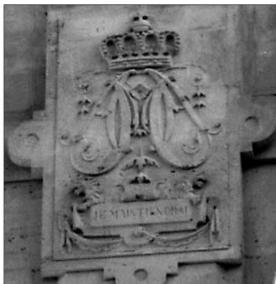
Auszüge aus einer Veröffentlichung des Stadtarchivars i.R., Heinz Sturm-Godramstein, in Nass. Ann. 1982, Bd. 93, S. 225-238, Überarbeitung sowie eigene Ergänzungen

JE MAINTIENDRAI Ich werde mich behaupten.